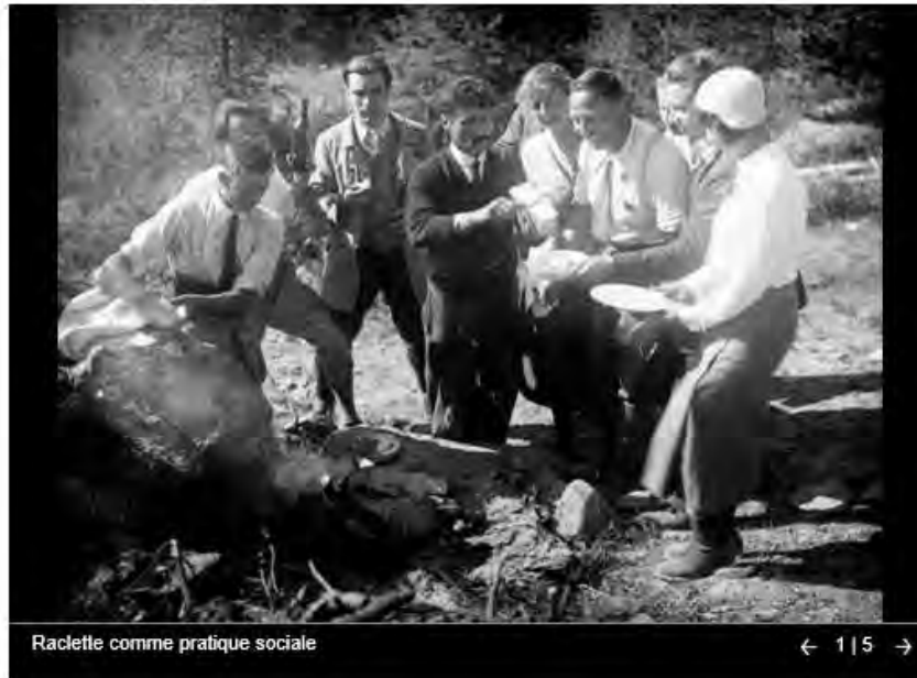
Raclette comme pratique sociale