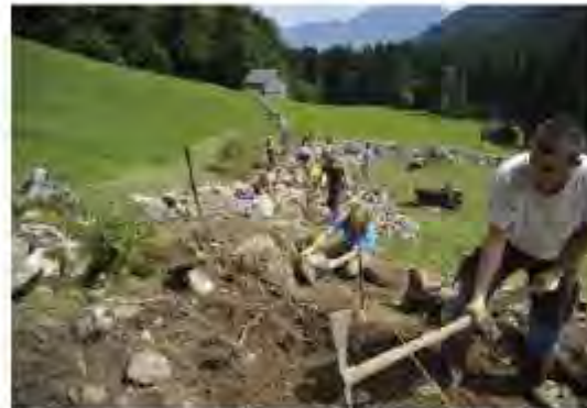
Zivildienst-Einsatz Stiftung Umwelt-Einsatz Schweiz, Grabs, Kanton St. Gallen, 2010

Natursteine ohne Verwendung von Mörtel, Zement und Kleber zu stabilen und langlebigen Trockenmauern aufzuschichten, ist eine Jahrhunderte alte Tradition. Trockenmauern gehören zum Kulturlandschaftsbild der Schweiz. Sie sind Zeugnis ländlicher Baukultur und Handwerkskunst. Sie bieten wertvollen Lebensraum für Pflanzen und Tiere, fördern dadurch die Biodiversität. Aus Freude an den schön gestalteten Formen und im Wissen um die vielfältigen Funktionen der aufgeschichteten Steinwälle setzen sich diverse Organisationen, Handwerker und Handwerkerinnen für die alte Bautechnik ein. Durch ihre Vermittlung von Fachwissen bewahren sie alte Trockenmauern vor dem Verfall. In Baukursen und durch Zivildienst-Einsätze werden neue Mauern errichtet. Auch in neue Gartenanlagen werden Trockenmauern vermehrt integriert. In den vergangenen Jahren haben Trockenmauern steigende Aufmerksamkeit erhalten. Deren handwerkliche, ästhetische und ökologische Bedeutsamkeiten sind heute anerkannt.